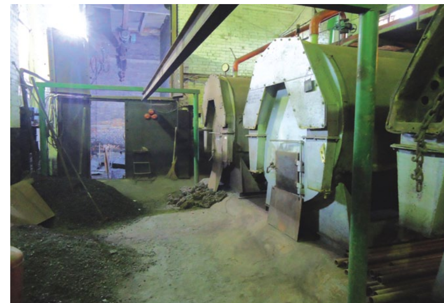
Угольная котельная №41 по ул. Молодежная 56, г. Гуково