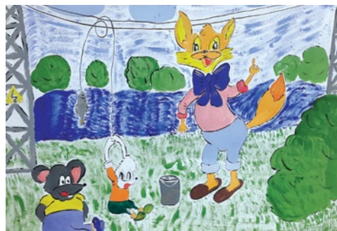
На рыбалке Генералова Евгения (8 лет)