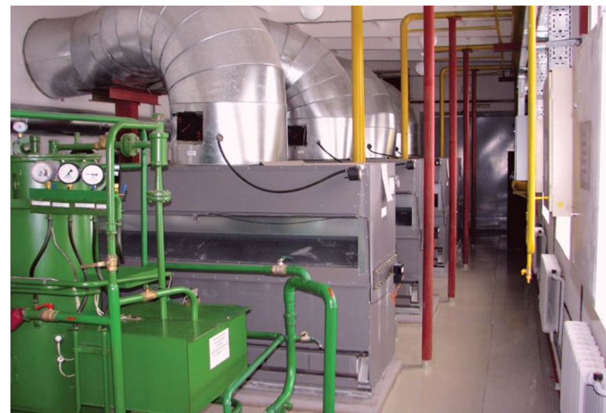
Газовая котельная №14 по ул. Пролетарская 100а, г. Батайск

На сегодняшний день актуальная проектная документация уже имеется по 33 объектам. Таким образом обеспеченность инвестиционной программой проектной документацией составляет 35,3% от количества объектов или 55% от суммы капложений.