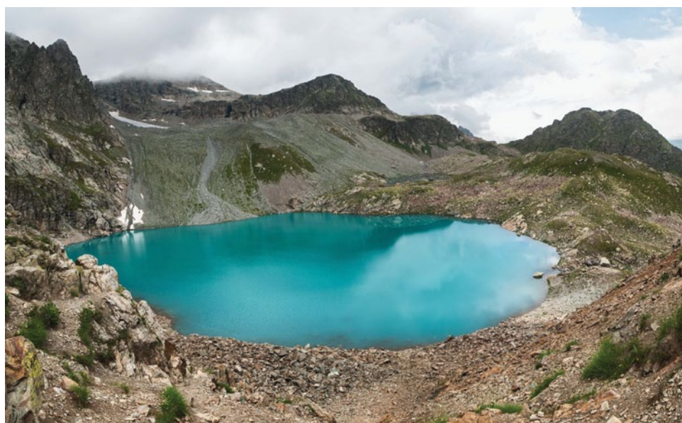
Верхнее Софийское Озеро