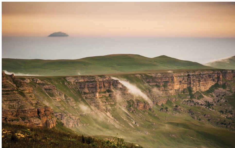
Утренний туман падает по склонам плато Бермамыт