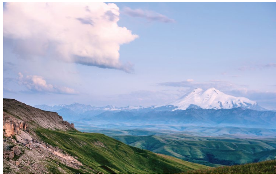
Плато Бермамыт. Вид на Эльбурс