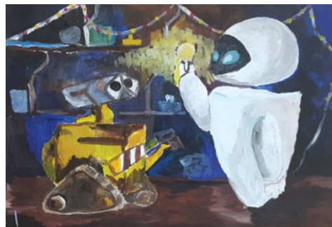
Светлый момент Фетисова Анастасия (14 лет)